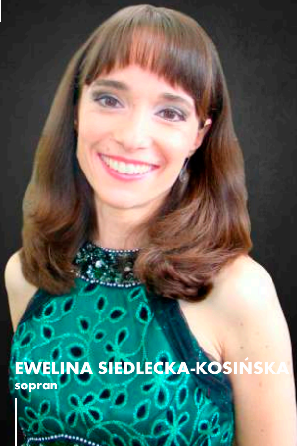
EWELINA SIEDLECKA-KOSIŃSKA sopran